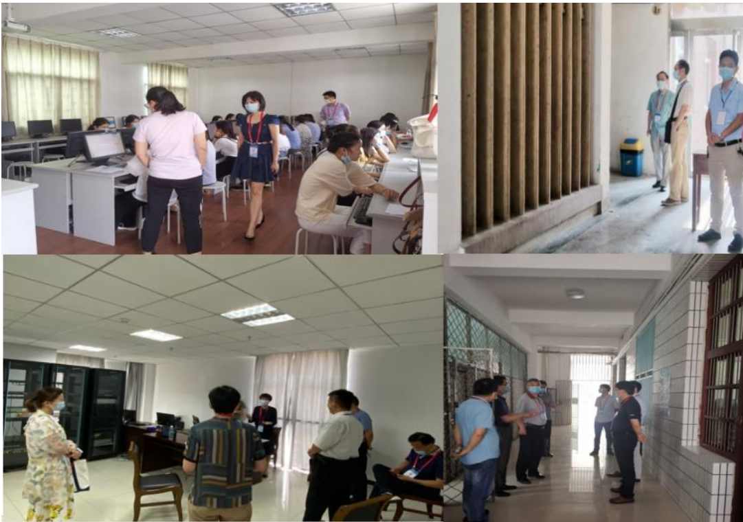
■ 联盟高校人员在滁州、宿州、阜阳、亳州等分校考点巡考督查

● 考场布置： 各考点（分校）门口安排独立考生通道，由工作人员检查准考证、测体温，体温达标进入考点；机房楼入口安排独立考生通道，由工作人员检查安康码、疫情防