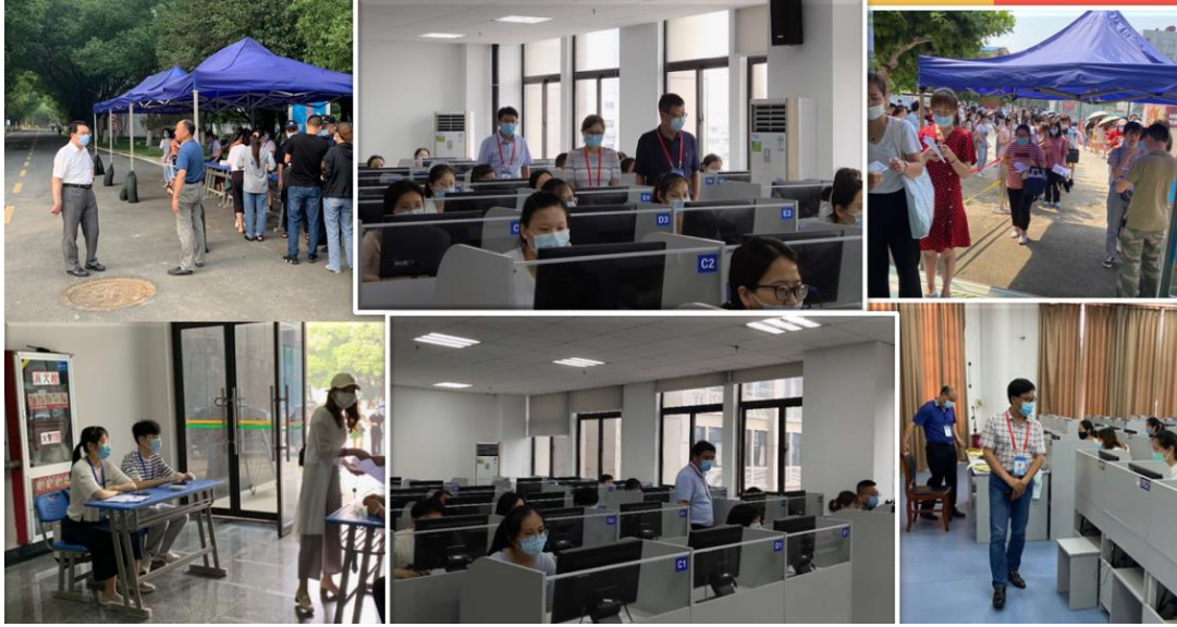
■ 联盟高校人员在省电大（合肥本部）巡考督查