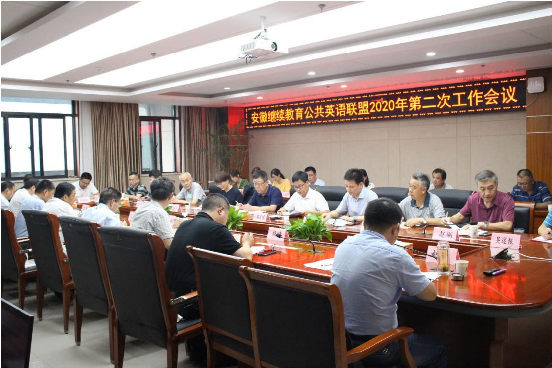
■ 安徽继续教育公共英语联盟 2020 年第二次工作会议