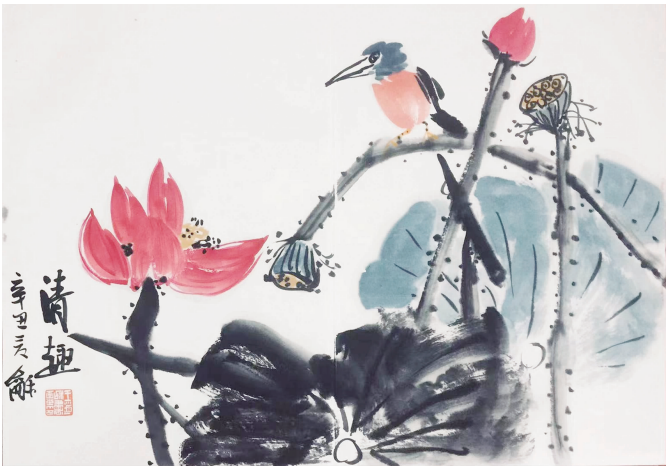
王道和 \ 画

要始终主动面对困难。读书时，我有幸遇到很多知识渊博又深受学生喜爱的老师。对这些老师，当时的我不仅崇敬，更