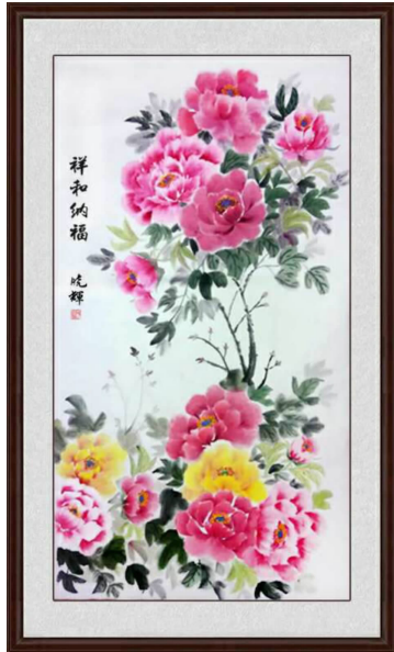
光晓辉 \ 画

编者按： 为深入推进我省老年远程教育工作，彰显老年大学学员在抗疫期间“停课不停学”的精神风貌，丰富老年群体的文化生活，7 月上旬，安徽省老年大学协会与安徽老年开放大学联合下发通知，共同举办“乐学抗疫”学习成果才艺线上评比活动。活动以“居家学才艺，抗疫添活力”为主题，共收到参赛作品 1134 幅。经网络投票和专家评审，11 月中旬，共评选出一等奖 5 名，二等奖 10 名，三等奖 15 名，优秀奖 100 名，优秀组织奖 5 个。本期刊登的 5 幅作品为一等奖获奖作品。