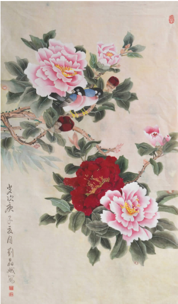
刘晶城 \ 画