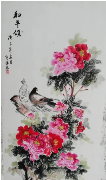
邵亨悌 \ 画