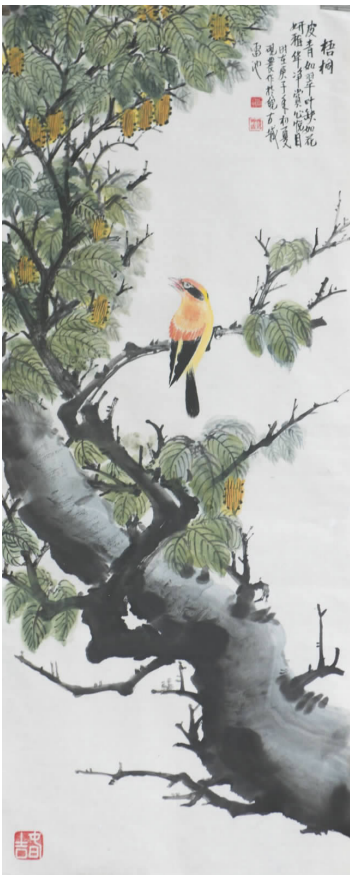
钱砚农 \ 画