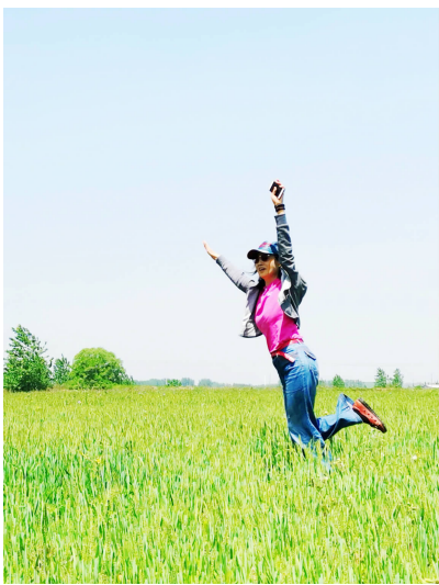
快乐的女人

夏天即将到来，气温越来越高，不少人已经开始使用空调了。有的人在外面大汗淋漓，一回到家就打开空调，对着空调直吹，也有的人窝在空调房里一整天等等，其实这些做法都不是空调的正确打开方式。