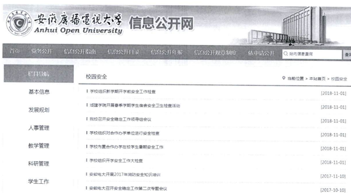
图 5 信息公开网“校园安全”专栏截图

5. 校园安全方面。建立“校园安全”校园网站信息公开专栏，公开报道校园安全稳定情况等。通过校内公告栏、校报、海报、宣传单页等媒介向校内师生宣传安全稳定知识，建立节假日值班制度及教师日常值班制，节假日值班主要有处级干部承担，教师日常值班由辅导员和城建学院部分教师承担，巡查校园安全稳定状况，填写值班记录表，做好校园安全记录，方便师生随时查阅。