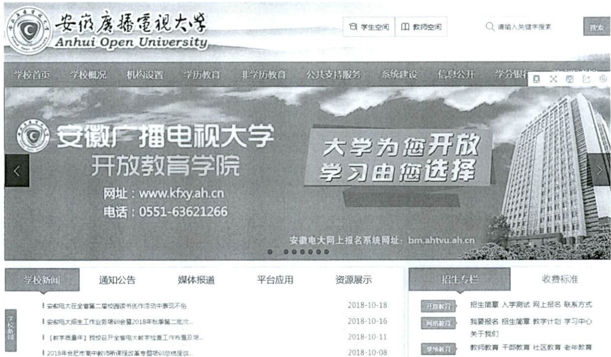
图 1 校园网首页“招生专栏”板块截图

公开。学校网站专门设立了“招生就业”专栏（如下图所示），公开学校各类形式教学的招生信息，同时学校通过校园网站公开的招生信息共计 200 余项。