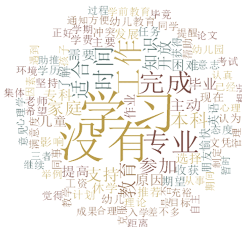
图 2 访谈文本词频分析

主要借助 QDA 软件(Nvivo12)对访谈进行文本资料的转录、抓取和分析等。访谈后逐字将访谈中获得的录音材料转录为文字稿,对文本进行词频分析。根据词频分析结果与持久学习动力框架模型,归纳出最简要明了的词语标签。对访谈文本进行一级编码,并对重叠与冗余的一级编码进行删减与合并,形成二级编码与三级编码。通过对文本的词频分析(见图 2),发现出现频率最高的词汇是“学习”,其次是“没有”(针对是否有休学经历的提问)，“工作”和“时间”出现的频率紧随其后。这些高频词进一步说明,被访者在实际学习中虽然存在工学矛盾这个大阻力,但学习始终是他们心之所系,他们对完成学业所表现出的正向态度,为培育、维持持久学习动力提供了良好的心理基础。