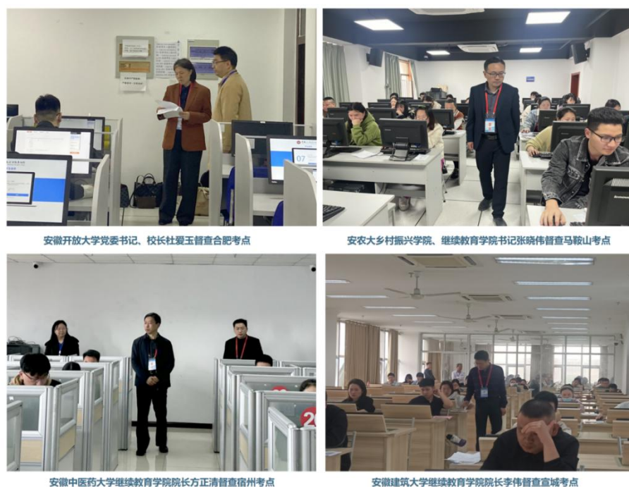
图 2：2024 年上半年学位外语考试部分督查情况

强化组织领导。 成立考试领导小组，由安徽开放大学党委书记、校长担任组长，安徽开放大学党委委员、副校长和联盟理事长单位负责人担任副组长，联盟各高校继续教育学院负责人、考点负责人担任成员，领导小组下设办公室和考务工作组。办公室设在联盟秘书处（园区管理中心），考务工作组统筹协调具体组考工作。