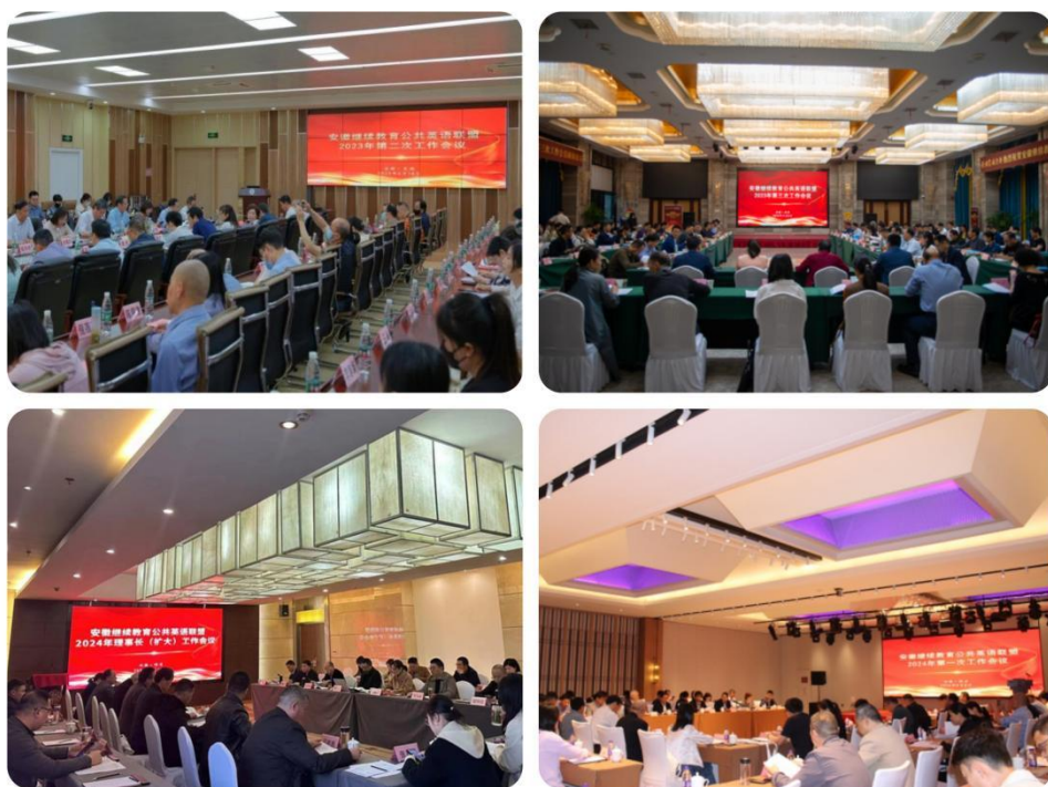
图 3：近两年联盟部分会议现场

认定与转换工作。《方案》的实施为做好高等学历继续教育教学管理工作，满足学习者多样化学习和发展的需要，建立课程教学与多种学习方式互通机制提供便利，也是我省通过对联盟学位外语学习成果存储、认定与转换的试行，进一步把终身教育学分银行“统一规划、试点先行、以点促面、分期推进”的建设理念落到实处。