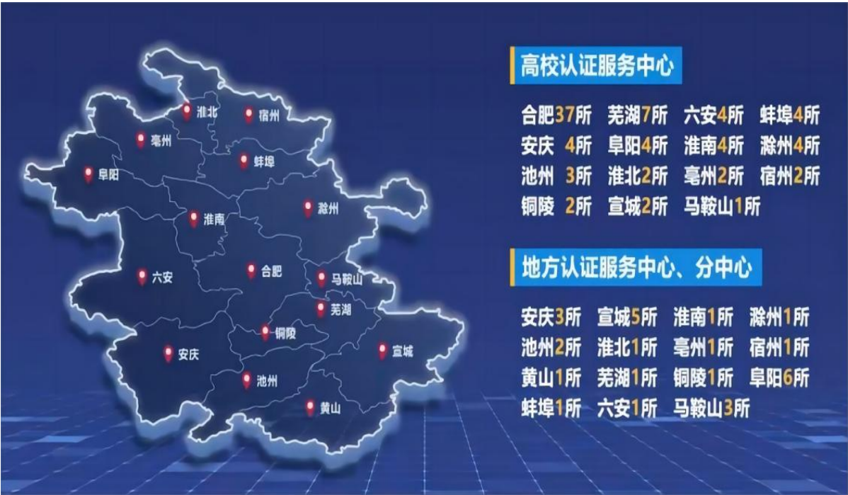
图 2：安徽省学习成果认证服务中心分布图

个地方认证服务中心，4 所中职、技工院校试点认证中心，13 个县级、高校认证服务分中心（见图 2）。