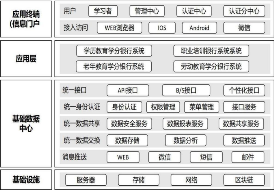
图 1：学分银行平台架构图

行数字化平台，包含门户网站、管理系统、各类信息库和数据处理信息系统四大模块，支持认证课程 245 门，证书 109 类，为 110 万余名学习者建立学习账户，累计产生学习成果 900 万条。同时加快长三角地区开放教育学分银行信息化平台建设，推进接入长三角一网通办平台。2023 年学分银行建设获省级政务信息化项目立项资助，升级学分银行现有平台，拓展多元场景运用（见图 1）。