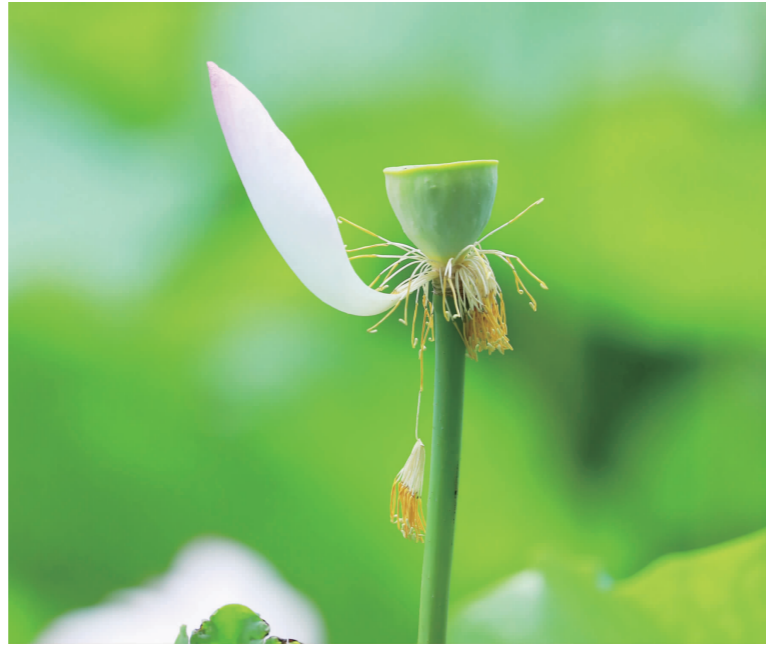
今夏的莲蓬