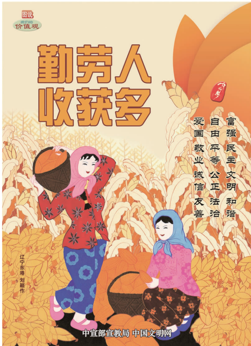
中宣部宣教局 中国文明网

在学籍科，这样的事例其实很多。有与国家开放大学学籍部门及时沟通，为学生加急办理毕